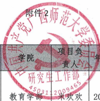
硕士研究生创新计划项目结题汇总表