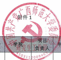
博士研究生创新计划结题汇总表